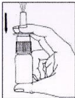
2. Antes de usar, pulsar la bomba unas veces (3-4 veces) hasta pulverización constante