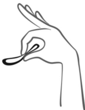
Comprimir el anillo