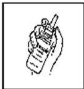
2. Colocar en la mano sujetando el frasco entre la palma y los dedos índice y pulgar.