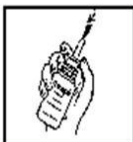
3. Dirigir hacia la nariz y presionar hacia abajo.