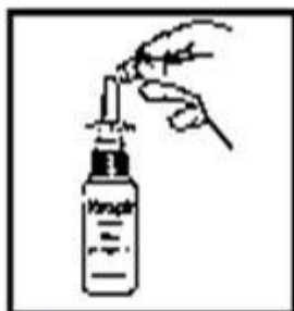
1. Quitar tapón de protección