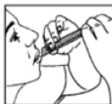
Llevar a la boca presionar y extraer

Si los síntomas empeoran o persisten después de 7 días debe consultar a su médico.