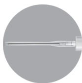
needle 1 - 38 mm