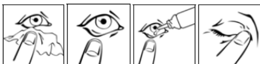
Esquema 1 Esquema 2 Esquema 3 Esquema 4