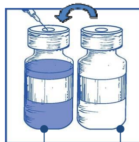
Mezcla concentrado-disolvente 10 mg/ml

Una vez reconstituido, la solución resultante contiene 10 mg/ml de cabazitaxel.