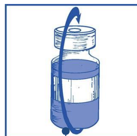
Mezcla concentrado-disolvente 10 mg/ml

Sacar la jeringa y la aguja y mezclar manualmente y suavemente, mediante inversiones repetidas, hasta que se obtenga una solución transparente y homogénea. Se pueden tardar unos 45 segundos.