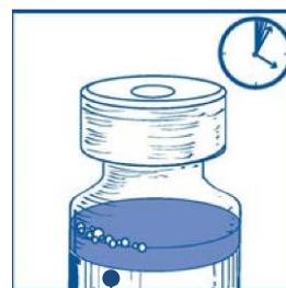
Mezcla concentrado-disolvente 10 mg/ml

Es normal que persista la espuma pasado este tiempo.