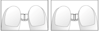
Dibujos 3 y 4: Fácil rotura de la mitad del comprimido de 5 mg de nebivolol ranurado en forma de cruz en un cuarto.