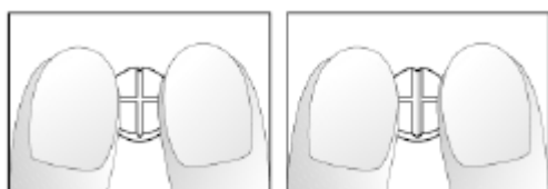
Dibujos 1 y 2: Fácil rotura del comprimido de 5 mg de nebivolol ranurado en forma de cruz en una mitad.