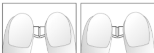
Dibujos 3 y 4: Fácil rotura de la mitad del comprimido de 5 mg de nebivolol ranurado en forma de cruz en un cuarto.