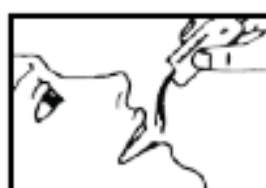
3. Puede tomarlo directamente