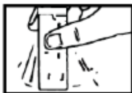
1. Sujetar firmemente el sobre de Citicolina

La dosis normal es de 1 a 2 sobres al día, en función de la gravedad de su enfermedad. Puede tomarse directamente o disuelta en medio vaso de agua (120 ml) con las comidas o fuera de ellas.