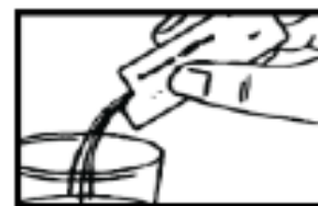
4. Disolverlo en medio vaso de