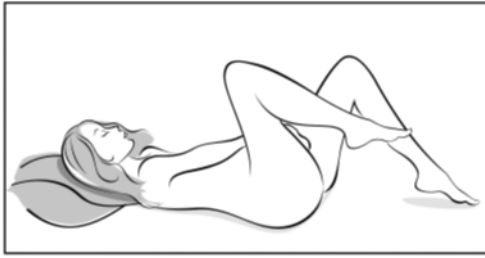
Figura 3 Escoja una posición cómoda para ponerse el anillo