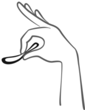
Figura 2 Presione el anillo