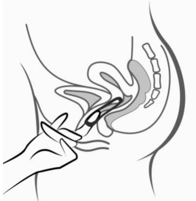
Figura 5: Ornibel puede retirarse enganchando el anillo con el dedo índice o sujetando entre el índice y el dedo medio y estirando hacia fuera.

Póngase el anillo en la vagina con una mano (Figura 4A), si es necesario separe los labios de la vagina con la otra. Empuje el anillo al interior de la vagina hasta que lo sienta cómodo (Figura 4B). Deje el anillo en la vagina durante 3 semanas (Figura 4C).